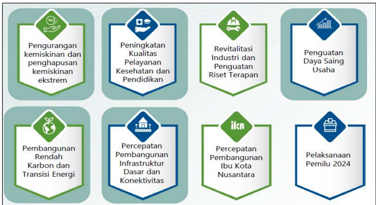
Gambar 3.1 Arah Kebijakan RKP Tahun 2024

Pada Tahun 2024, Tema Pembangunan Nasional yang ditetapkan dalam RKP Tahun 2024 adalah "Mempercepat Transformasi Ekonomi yang Inklusif dan Berkelanjutan" dengan 8 arah kebijakan sebagai berikut: